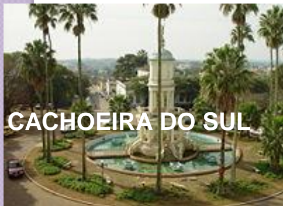
CACHOEIRA DO SUL