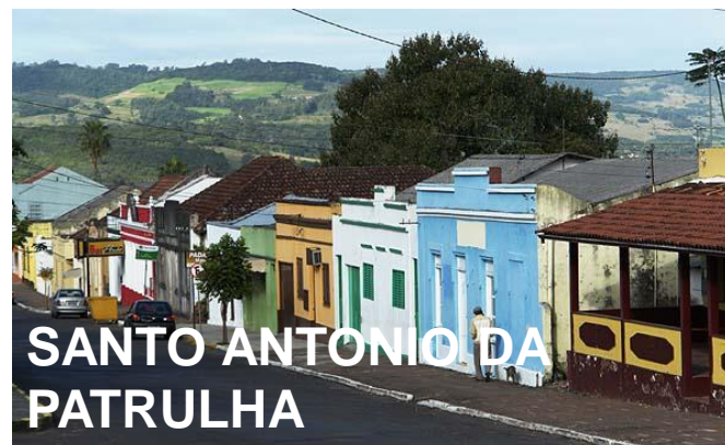
SANTO ANTONIO DA PATRULHA